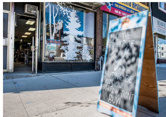
Toronto Tool Library

Eine Bibliothek der Dinge funktioniert wie eine herkömmliche Bibliothek, nur kann man sich anstelle von Büchern Dinge des alltäglichen und außeralltäglichen Bedarfes ausleihen.